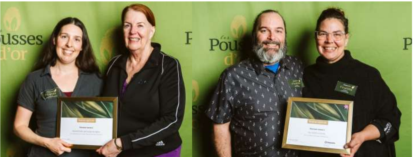
Ferme de la Canopée (à gauche) et Aux Jardins Colorés (à droite)